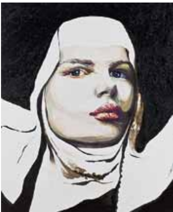
Cornelia Schleime, Bernadette, 2002, Acryl, Schellack auf Leinwand, 200 x 160cm

This year the museum is presenting the past decade's most significant acquisitions. The first section of the exhibition, until July 8, 2012, consists of approximately 60 paintings and sculptures on display in the Rathaushalle. The PackHof, a space situated on the banks of the Oder River, will serve as the venue for an additional exhibition of some 60 prints and hand drawings until July 29, 2012.