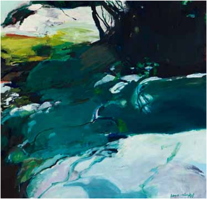
Herta Müller, Seta 1. 2011. Öl auf Leinwand. 155 x 150 cm, © Herta Müller, Katrin Rother (Werkaufnahme)

Farben sind härter, weniger vom verschwimmenden Silbrigen der Luft beeindruckt, sondern von den klaren Farbspielen einer etwas kühleren Temperatur. Hier kommt die Zeichnerin indirekt ins Spiel, die präzise, von der Linie bestimmte Erfassung des Gegenstandes setzt sich nun in der Klarheit der Farben fort.“