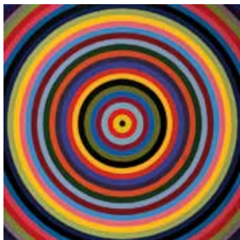
Poul Gernes, Ohne Titel (Target), 1966–68