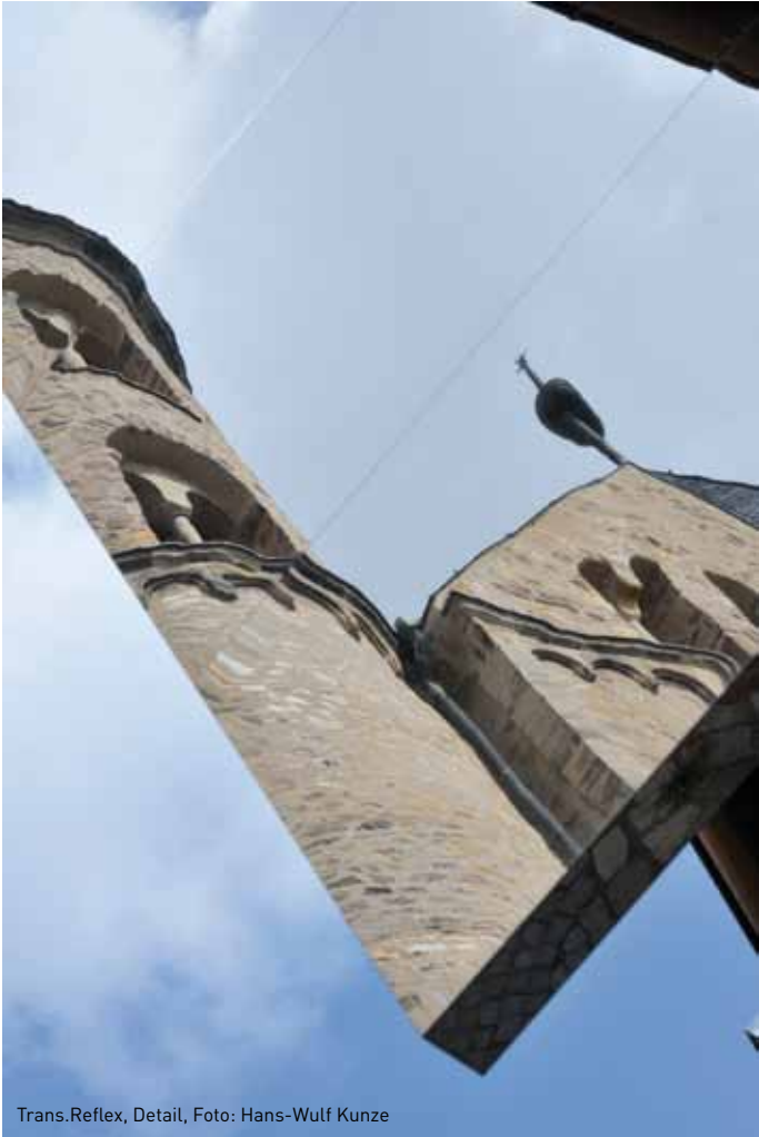
Trans.Reflex, Detail